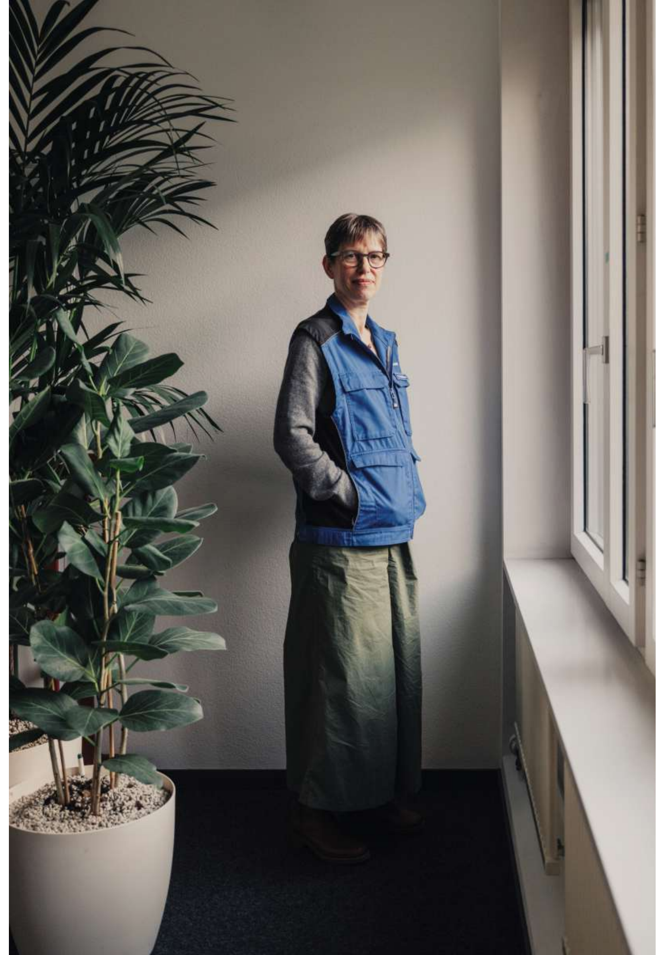
«Sie öffnen uns die Tür nackt.»

Manche Kontrollierte wählten eine andere Taktik: «Sie öffnen uns die Tür nackt.» Besonders Männer tun das oft, um uns einzuschüchtern. «Ich