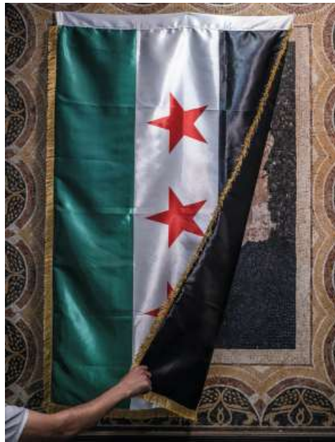
8 Syrien: Zu einem neuen Staat gehört auch eine neue Flagge.