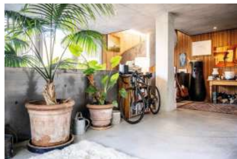
58 Ist das Rennrad ein Sportgerät oder eher ein Ausstellungsobjekt?